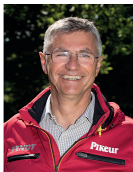
Otto Becker, Bundestrainer Springen

Um erfolgreich zu bleiben, brauchen wir auch weiterhin gute Trainer. Dafür vertrauen wir auf bewährte praktische Erfahrungen. Um das Training zu optimieren, müssen wir aber auch über den Tellerrand hinaus schauen und offen für Neues sein.