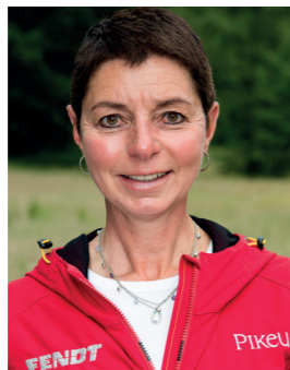
Monica Theodorescu, Bundestrainerin Dressur

Seit vielen Jahrzehnten hat der Pferdesport das Glück, auf das Wissen alter Meister und die Erfahrung der von ihnen ausgebildeten Spitzentrainer und Reiter zurückgreifen zu können. Dies gilt es nun auf die nächste Generation zu übertragen.